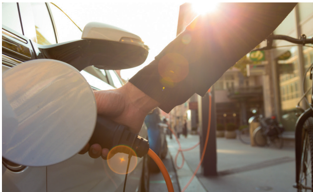
Neue Mobilitätskonzepte sind gefragt

Aus diesen und weiteren Gründen veranstalten das Kompetenzzentrum innovative Beschaffung und die IÖB-Service-stelle gemeinsam den Innovationsschauplatz „Elektromobilität – Was geht in Kommunen?“ und freuen sich, Sie bei der kostenfreien Veranstaltung im Airport Hilton Hotel München begrüßen zu dürfen.