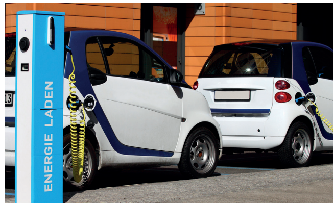
Ladeinfrastruktur in die Stadt- und Verkehrsplanung integrieren

Das Kompetenzzentrum innovative Beschaffung (KOINNO) wird im Auftrag des Bundesministeriums für Wirtschaft und Energie durch den Bundesverband Materialwirtschaft, Einkauf und Logistik e.V. (BME) geleitet. KOINNO ist zentrale Anlaufstelle für öffentliche Auftraggeber und berät bei innovativen Beschaffungsvorhaben, Neustrukturierungen oder Bestandsanalysen im öffentlichen Einkauf.